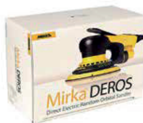
MID5502011 MID6252011 MID6502011

В комплект DEROS в кейсе входят подошвы 125 мм и 150 мм. Выбирайте подошву, подходящую для Вашей шлифовальной операции.